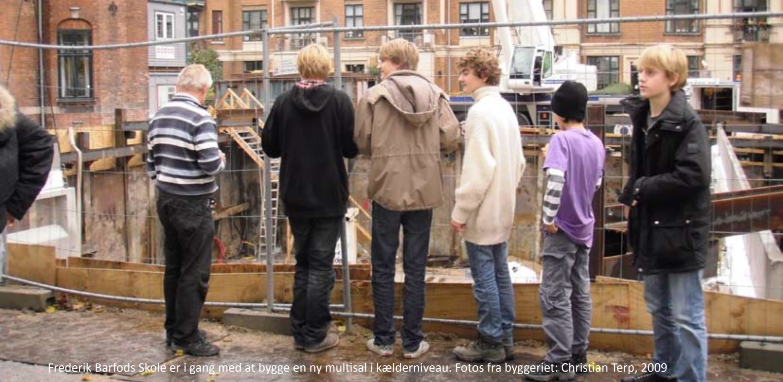
Frederik Barfods Skole er i gang med at bygge en ny multisal i kælderniveau.