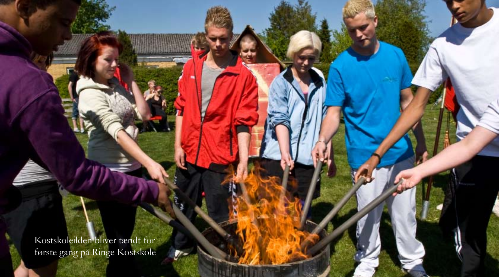
Kostskoleilden bliver tændt for første gang på Ringe Kostskole