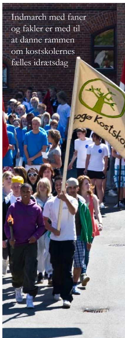
Indmarch med faner og fakler er med til at danne rammen om kostskolernes fælles idrætsdag