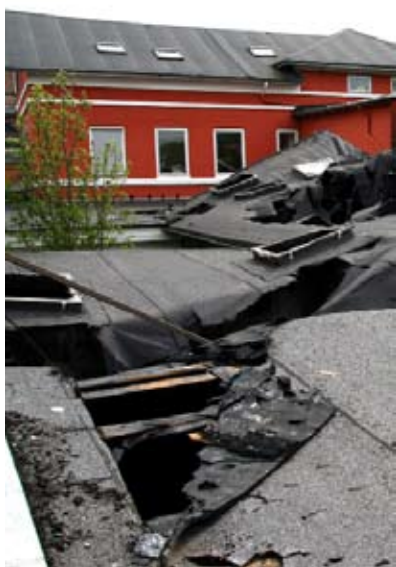
Resterne af taget på Nyborg Private Realskoles gymnastiksal