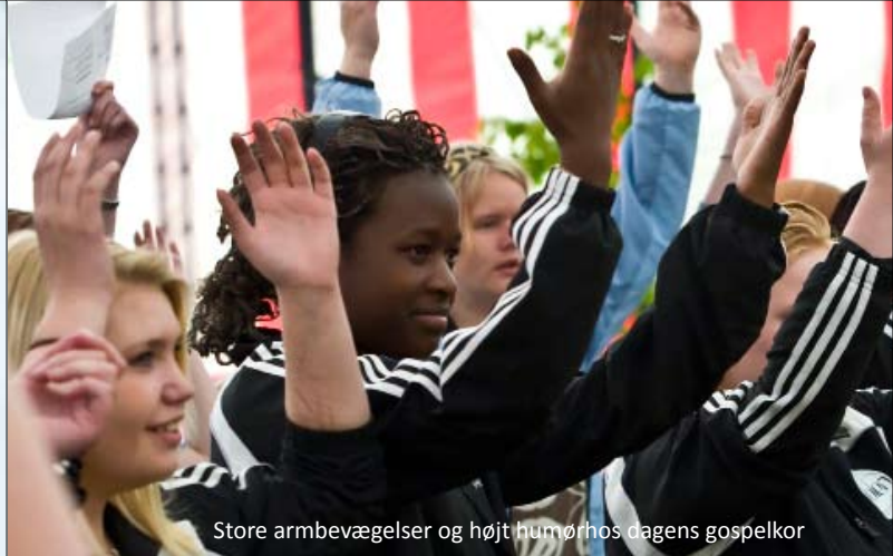
Store armbevægelser og højt humør hos dagens gospelkor