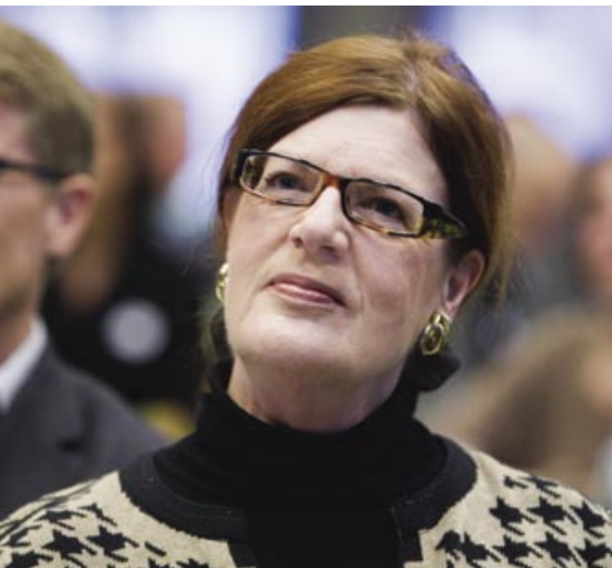
Medlem af Folketingets uddannelsesudvalg MF Britta Schall Holberg (V) lagde turen forbi DP's årsmøde.