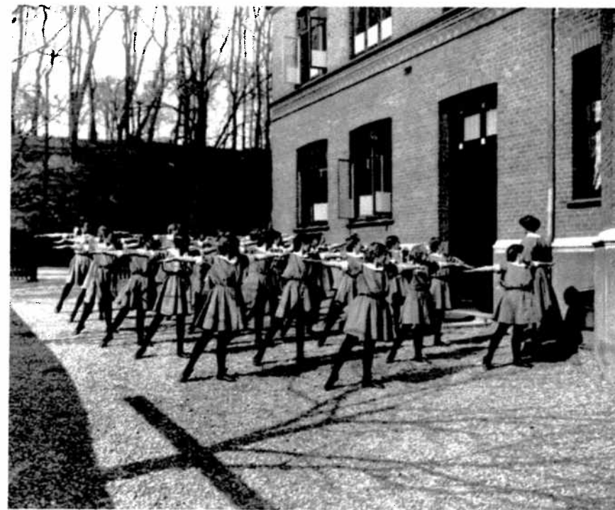
Gymnastiktime på la Cours Skole.

Denne udvikling og især den gratis skolegang i den kommunale eksamensskole afspejlede sig også i de private realskoleers elevtal. I skoleåret 1921/22 havde de tre skoler haft 726 elever, hvilket faldt til 688 elever i 1922/23 og til 605 elever i 1926/27. Det betød, at skolerne havde mistet 150 elever på fem år, jf. figur 1. Derimod voksede den kommunale mellemskole fra 480 elever i 1919/20, hvor der havde været