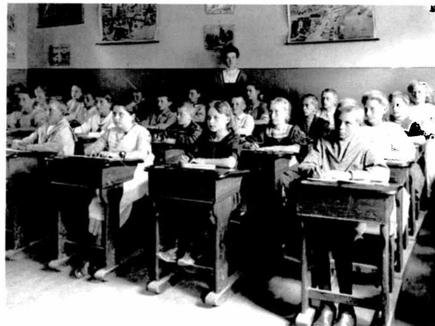
Elever på Randers Realskole cirka 1910. Læg mærke til pigen på forreste række, som har armbåndsur, halskæde og hvidt tøj på. Hun kom uden tvivl fra et velhavende hjem. På endevæggen hænger der anskuelsesbilleder, både af byliv, dyr og havneliv.

Skolen blev dog også ramt af, at undervisningen i den kommunale mellem- og realskole blev gratis og derved tiltrak flere elever. Fra begyndelsen af 1930'erne var der en mærkbar nedgang i elevtallet, fra 239 elever i 1931 til 125 elever i 1940.